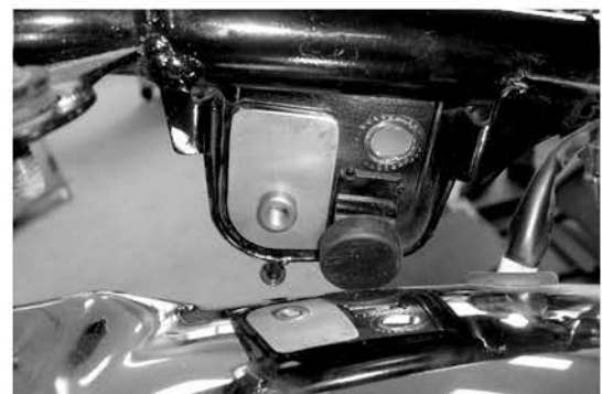
Ansicht von innen; Fahrtrichtung ->

Zur Verschraubung der Brücke die Linsenkopfschrauben M8 x 25 mit U-Scheiben verwenden.