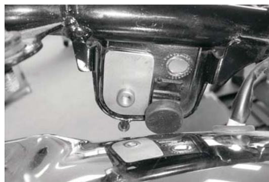
Ansicht von innen; Fahrtrichtung ->

Zur Verschraubung der Brücke die Linsenkopfschrauben M8 x 30 mit U-Scheiben verwenden.