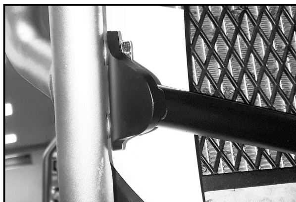
Abb.2 / Pic.2

In the direction of travel on the right with the original screw in the now free thread.