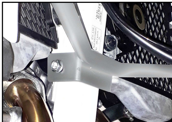
Abb.3 / Pic.3