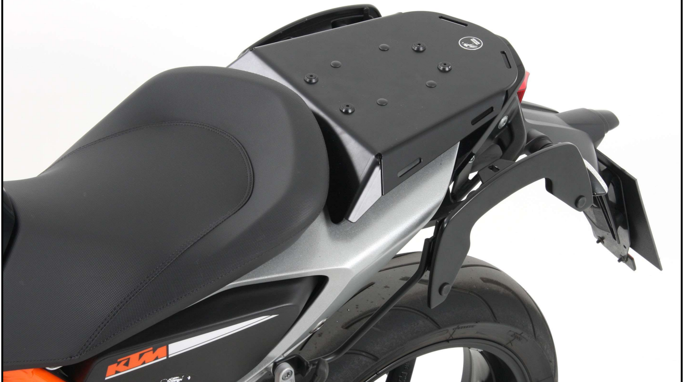
Bild zeigt als weiteres Zubehör den C-Bow Softtaschenhalter

Anzugsmomente des Motorradherstellers beachten! Nach der Montage alle Verschraubungen auf festen Sitz kontrollieren! Bitte beachten Sie unsere beigefügten Serviceinformationen.