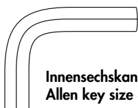
Innensechskantschlüssel Gr. 3 / Allen key size 3